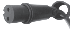
fig. 2. / 2. ábra / obraz 2. / Figura 2. / 2. skica / 2. skica / obraz 2.