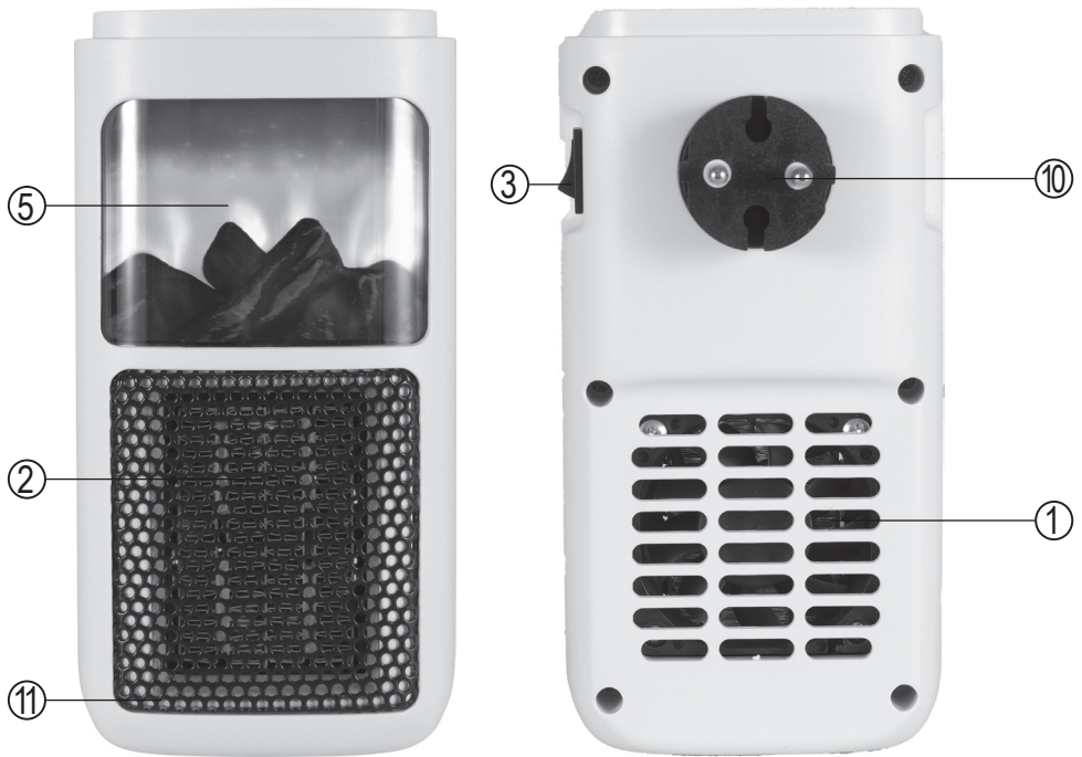
figure 2. • 2. ábra • 2. obraz • figura 2. • 2. skica • 2. obrázek • 2. slika