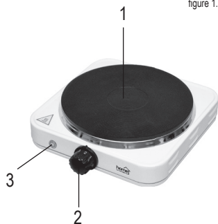
figure 1. • 1. ábra • 1. obraz • figura 1. • 1. skica • 1. obrázek • 1. slika